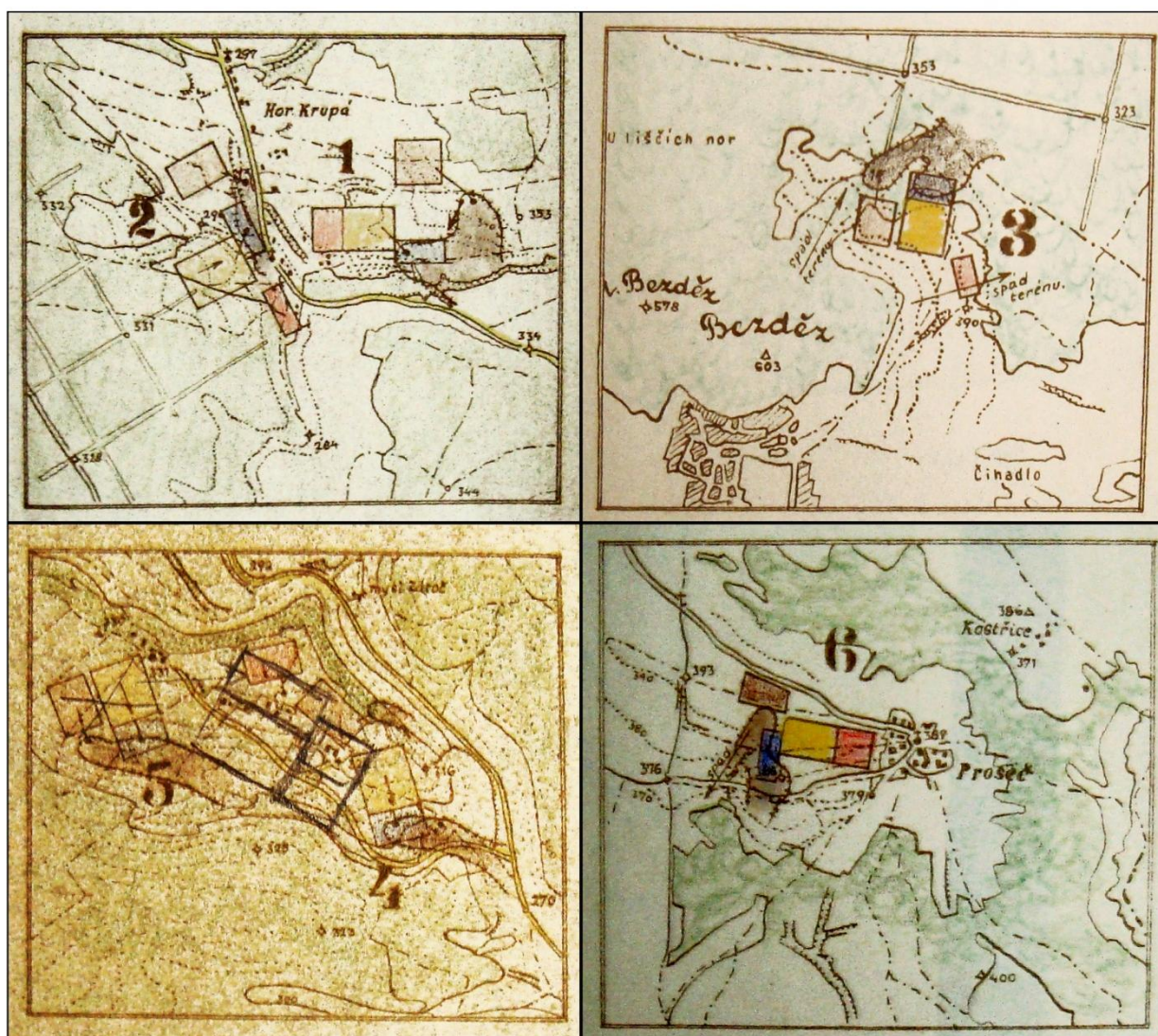
Obrázek 1 - 4